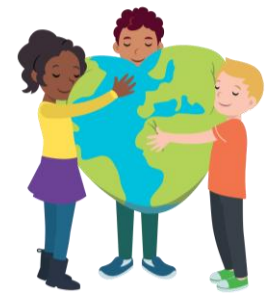
We hebben hart voor elkaar

Blok 4 gaat over gevoelens. Om kunnen gaan met gevoelens is van groot belang voor een positief klimaat in de klas en in de school. De Vreedzame School streeft naar een klimaat waarin iedereen zich prettig voelt en waarin kinderen "hart voor elkaar" hebben, d.w.z. dat ze met respect omgaan met elkaar. Dat gaat gemakkelijker als kinderen in staat zijn hun gevoelens te benoemen en zich in de gevoelens van anderen te verplaatsen. Kinderen zijn dan beter in staat om conflicten positief op te lossen.